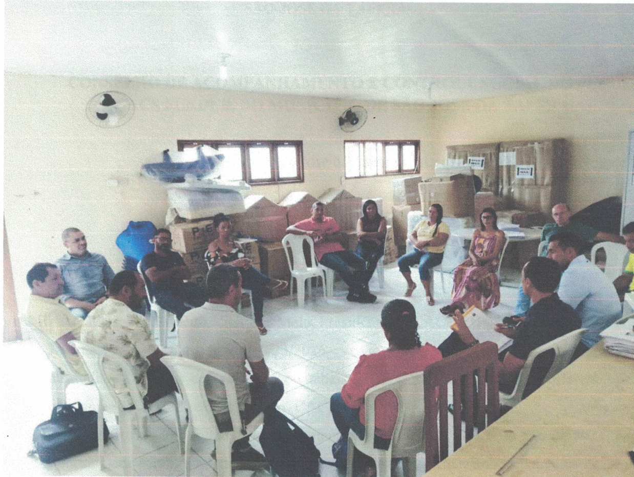
Registros em foto da reunião do dia: